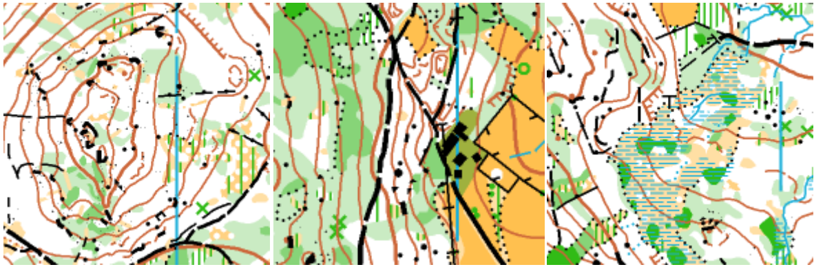
Trois aspects de la carte de Malaroche